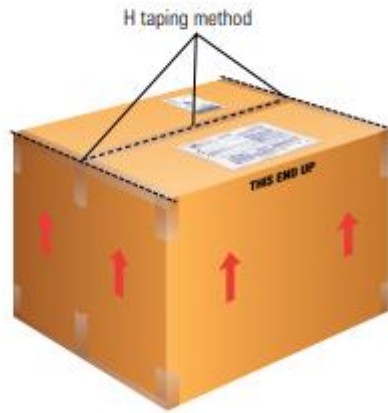
H 封箱 (取自 Fedex.com)